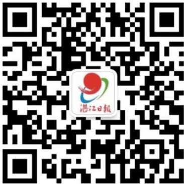
湛江日报公众号二维码