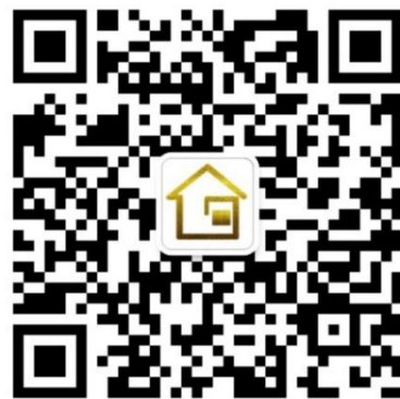
湛江佳房网公众号二维码